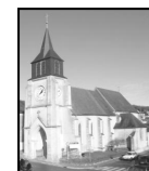
Chanteloup-les-Vignes Église Saint-Roch