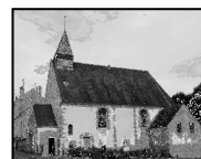
Carrières-sous-Poissy Église Saint-Joseph

La liturgie de ce jour nous fait découvrir que Dieu n'a pas créé l'Homme pour une existence impérissable et que la vie est plus forte que la mort. Quant à Jésus, il invite ainsi les croyants à tenir leur lampe allumée comme des bons serviteurs qui attendent le retour de leur Maître.