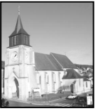
Chanteloup-les-Vignes Église Saint-Roch