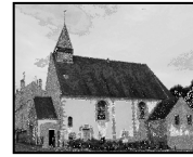
Carrières-sous-Poissy Église Saint-Joseph