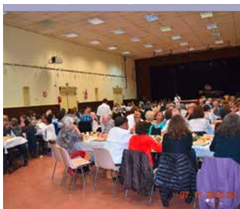
Table ouverte paroissiale (T.O.P)

C'est un repas fraternel, ouvert à tous, préparé par des personnes d'horizons différents. Il permet la rencontre, l'échange, la convivialité.