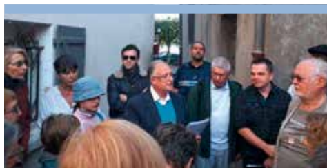
Table ouverte paroissiale (T.O.P)

C'est un repas fraternel, ouvert à tous, préparé par des personnes d'horizons différents. Il permet la rencontre, l'échange, la convivialité.