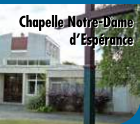
Chapelle Notre-Dame d'Espérance