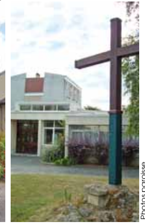
Chapelle Notre-Dame d'Espérance