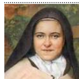
Ste Thérèse de l'Enfant Jésus

Coût total du pèlerinage : 750 € avec acheminements aéroport, sans les boissons.