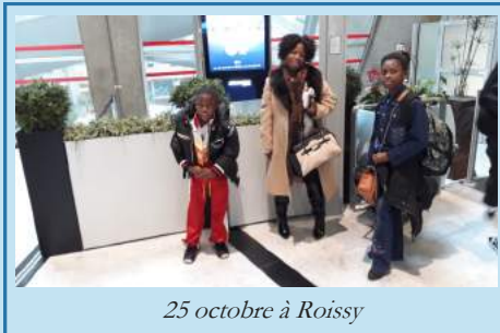
25 octobre à Roissy