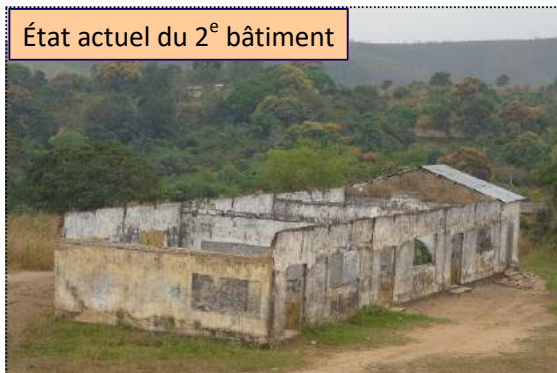
État actuel du 2 e bâtiment