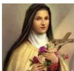
Ste Thérèse de l'Enfant Jésus