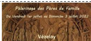
Pèlerinage des Pères de Famille Du Vendredi 1er juillet au Dimanche 3 juillet 2022

• Action Catholique Ouvrière (ACO) : Contact : Marie-José 06 44 77 19 19 Prochaine date : le dimanche 8 mai de 15 à 17h à la chapelle de Chanteloup