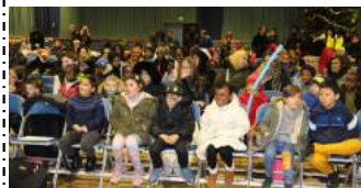
L'équipe Arbre de Noël

Nous tenons à remercier bien chaleureusement tous ceux qui ont contribué à faire de cet après-midi de décembre une réussite, et d'avoir rendu plus d'une centaine d'enfants très heureux ! Merci pour le don de votre présence, de votre aide physique et matérielle et de vos prières. Merci d'être des lumières dans la vie de chacune de ces familles. Belle et sainte année à tous !