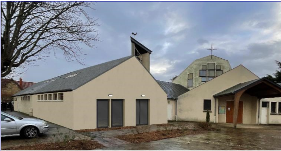
Illustration du projet d'agrandissement qui devrait être finalisé en juin 2025

Le coût qui en résulte est important : 612 000 €.