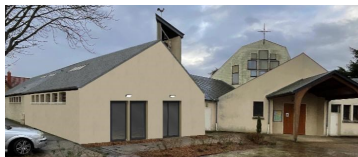
Illustration du projet

Soyez à l'avance remerciés de votre contribution.